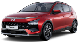
Dragon Red Pearl