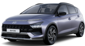
Meta Blue Pearl / Black roof