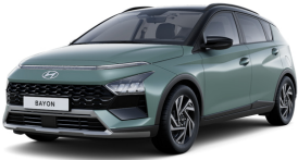
Green Pearl / Black roof