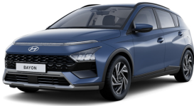
Vibrant Blue Pearl

NB! Ņemiet vērā, ka attēliem ir tikai ilustratīva nozīme. Automašīnas aprīkojums, tai skaitā jumta krāsa, sānu spoguļi, jumta reliņi, riteņu diski, aizmugurējie logi u.tml. var atšķirties atkarībā no izvēlēta aprīkojuma līmeņa.