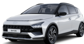
Atlas White / Black roof