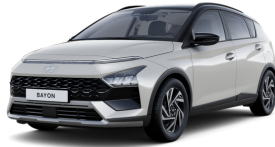
Lumen Grey Pearl / Black roof