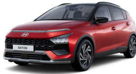
Dragon Red Pearl / Black roof