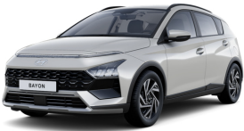
Lumen Gray Pearl