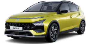
Lucid Lime Metallic / Black roof