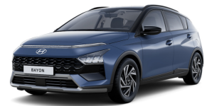
Vibrant Blue / Black roof