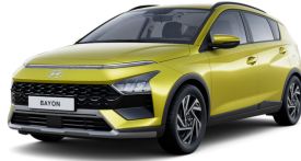
Lucid Lime Metallic