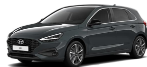
Cypress Green Pearl