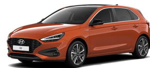
Jupiter Orange Metallic