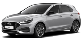
Shimmering Silver Metallic