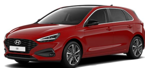
Ultimate Red Metallic

NB! Ņemiet vērā, ka attēliem ir tikai ilustratīva nozīme. Automašīnas aprīkojums, tai skaitā jumta krāsa, sānu spoguļi, jumta reliņi, riteņu diskus, aizmugurējie logi u.tml. var atšķirties atkarībā no izvēlēta aprīkojuma līmeņa.