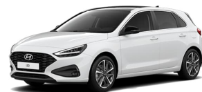
Serenity White Pearl