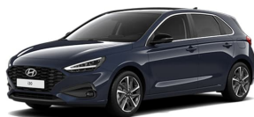
Sailing Blue Pearl