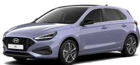
Meta Blue Pearl