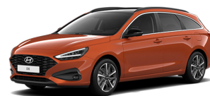
Jupiter Orange Metallic