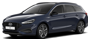
Sailing Blue Pearl