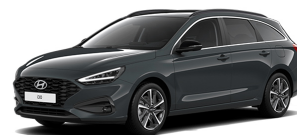
Cypress Green Pearl