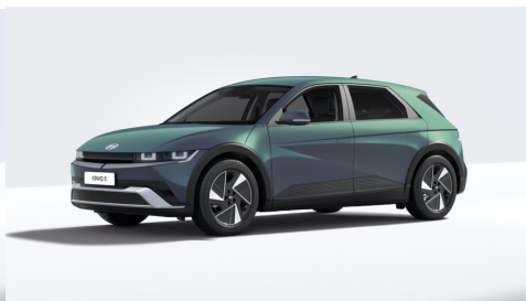
Digital Teal Green Pearl