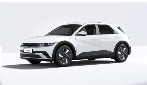
Atlas White Matte