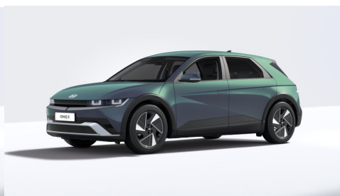
Digital Teal Green Pearl