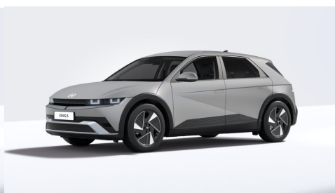
Gravity Gold Matte