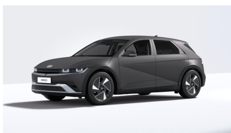
Ecotronic Gray Matte